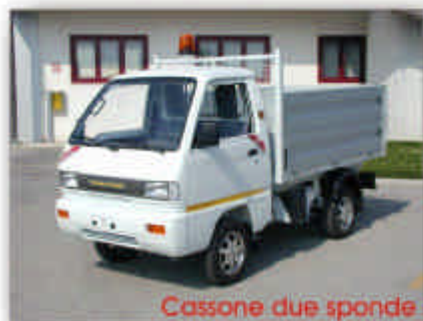
Cassone due sponde