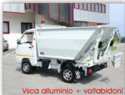
Vasca alluminio + voltabidoni